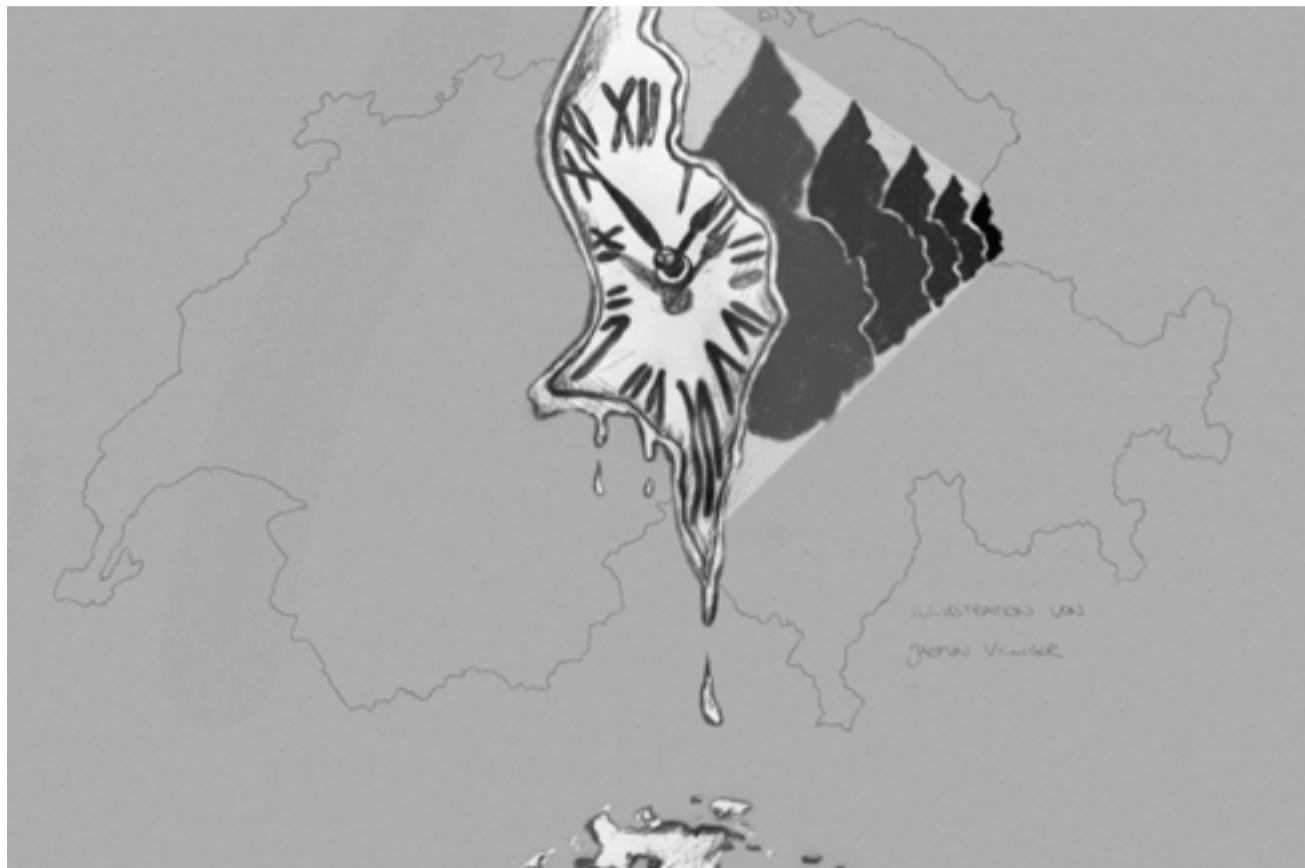
In restriktiven Kantonen kann nur noch bis Ende dieses Jahres eine Offenlegung gemacht werden.

Besondere Beachtung verdient dabei der Umstand, dass neu auch Liechtenstein mit der Schweiz Finanzinformationen austauschen wird. Der liechtensteinische Landtag hat dem Abkommen ebenfalls bereits zugestimmt, womit es wahrscheinlich ist, dass das Abkommen am 1. Januar 2018 in Kraft tritt. Letztlich bedeutet dies, dass die Schweiz spätestens im Sommer/Herbst 2019 die Informationen aus Liechtenstein übermittelt erhält. Wer noch undeklarierte Vermögenswerte in Liechtenstein liegen hat, tut gut daran, die Situation mit dem Schweizer Fiskus zu bereinigen. Als